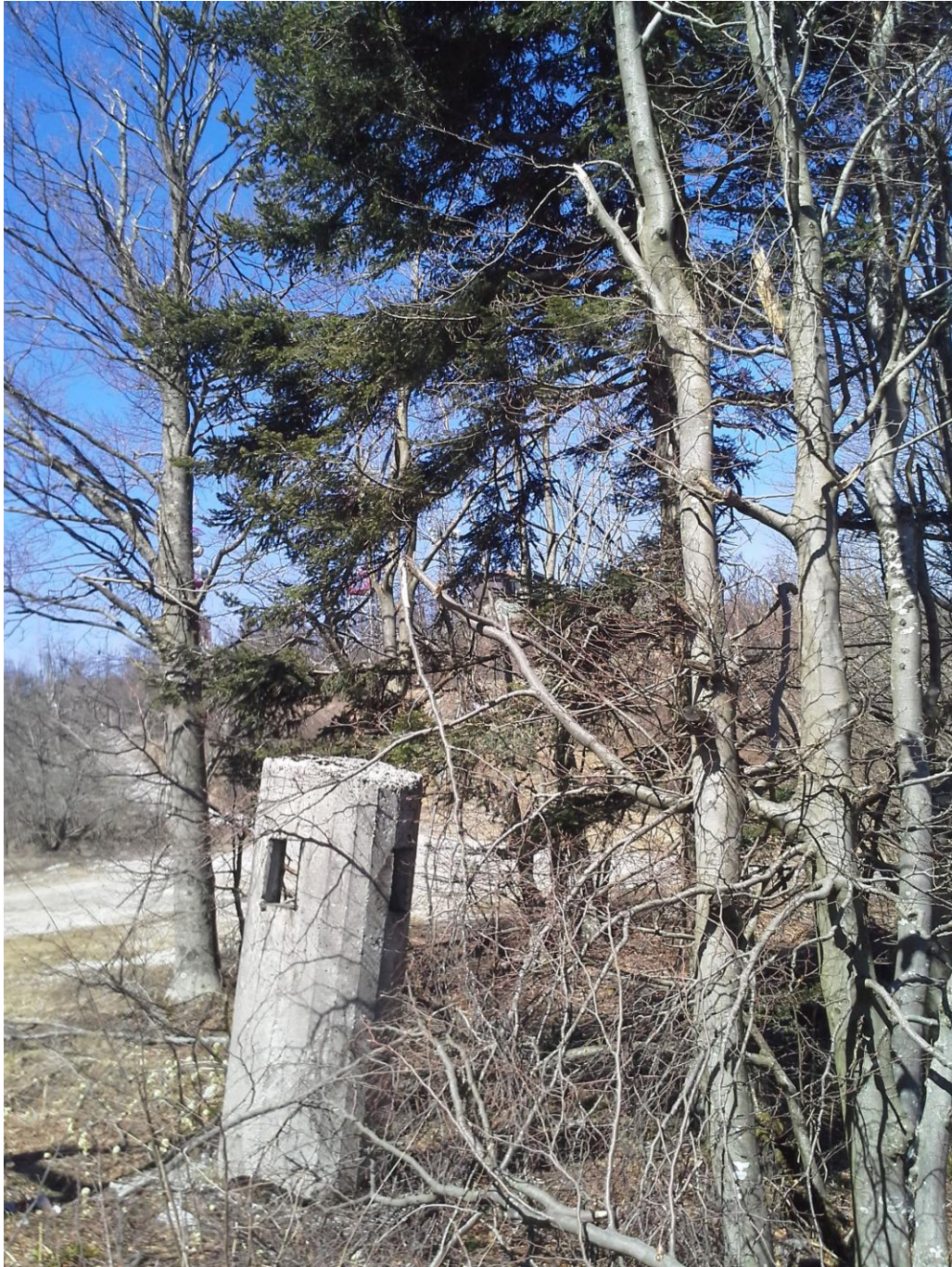
Krim 2015, bivše stražarsko mesto