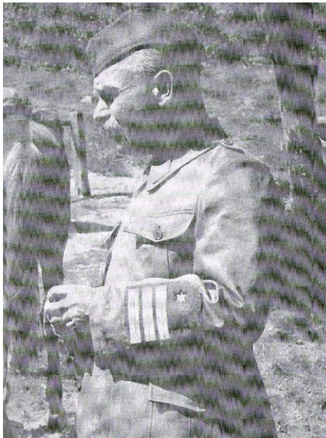
Slika 7: General Jaka Avšič

24. 4. 1896 (Kleče pri Ljubljani)–2. 1. 1978 (Ljubljana)