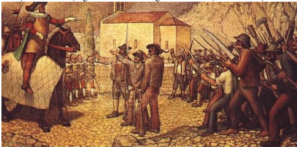
Slika 3: Kmečki upor