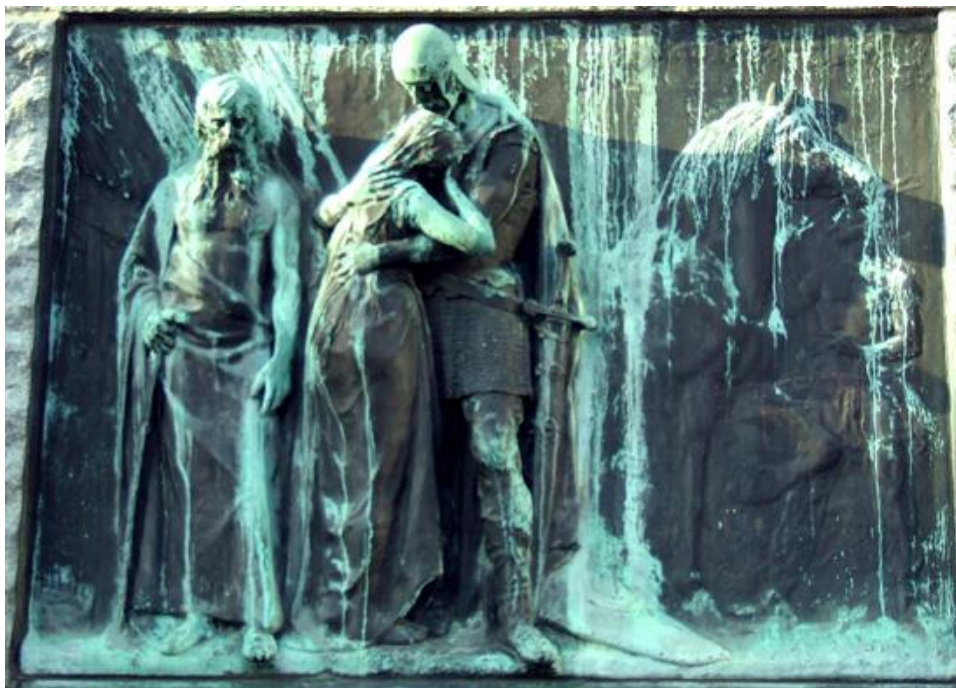
Slika 2: Črtomirjevo Slovo od Bogomile, relief, bron

Verjetno ste v krvoločnem Valjhunu prepoznali kneza Waltuncka, naš prvi junak pa naj bo Črtomir , ki v imenu ljubezni in miru na koncu vseeno kloni. V kolikor se sprehajate po Ljubljani in se znajdete na najznamenitejšem slovenskem trgu – Prešernovem trgu, postojte, in si na spodnjem delu spomenika poetu oglejte motive Črtomirjevega boja na bakrenih ploščah.