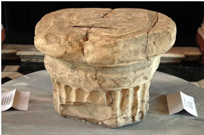
Slika 1: Knežji kamen, na katerem so ustoličevali karantanske kneze.